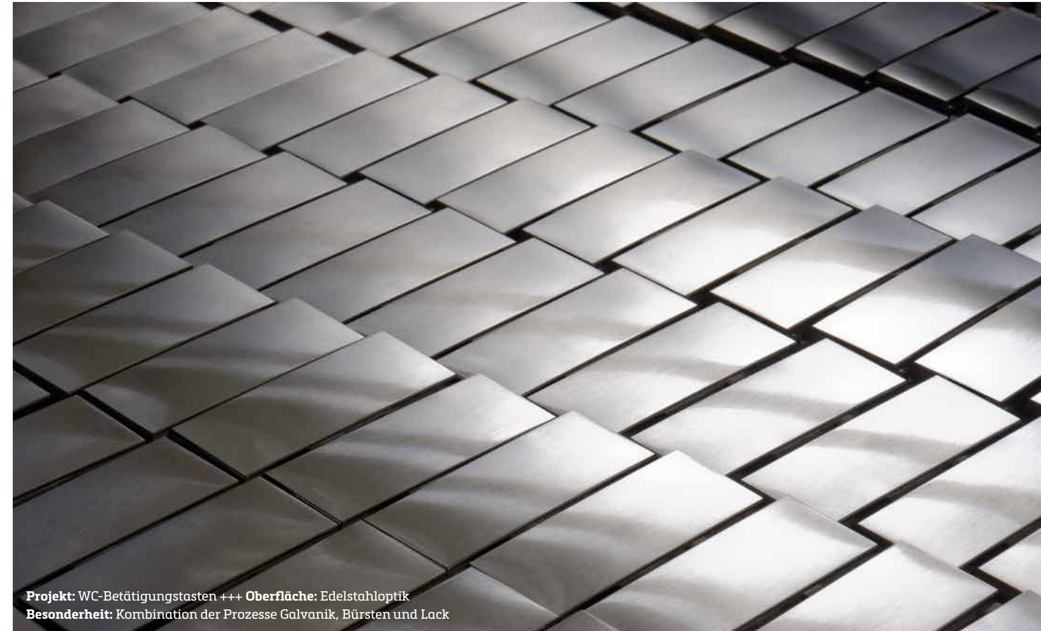
Projekt: WC-Betätigungstasten +++ Oberfläche: Edelstahloptik Besonderheit: Kombination der Prozesse Galvanik, Bürsten und Lack

Als Manufaktur mit erweiterter industrieller Fertigung beschichten wir auch größere Serien mit mehreren zehntausend Teilen jährlich in derselben hohen Qualität wie jedes Unikat.