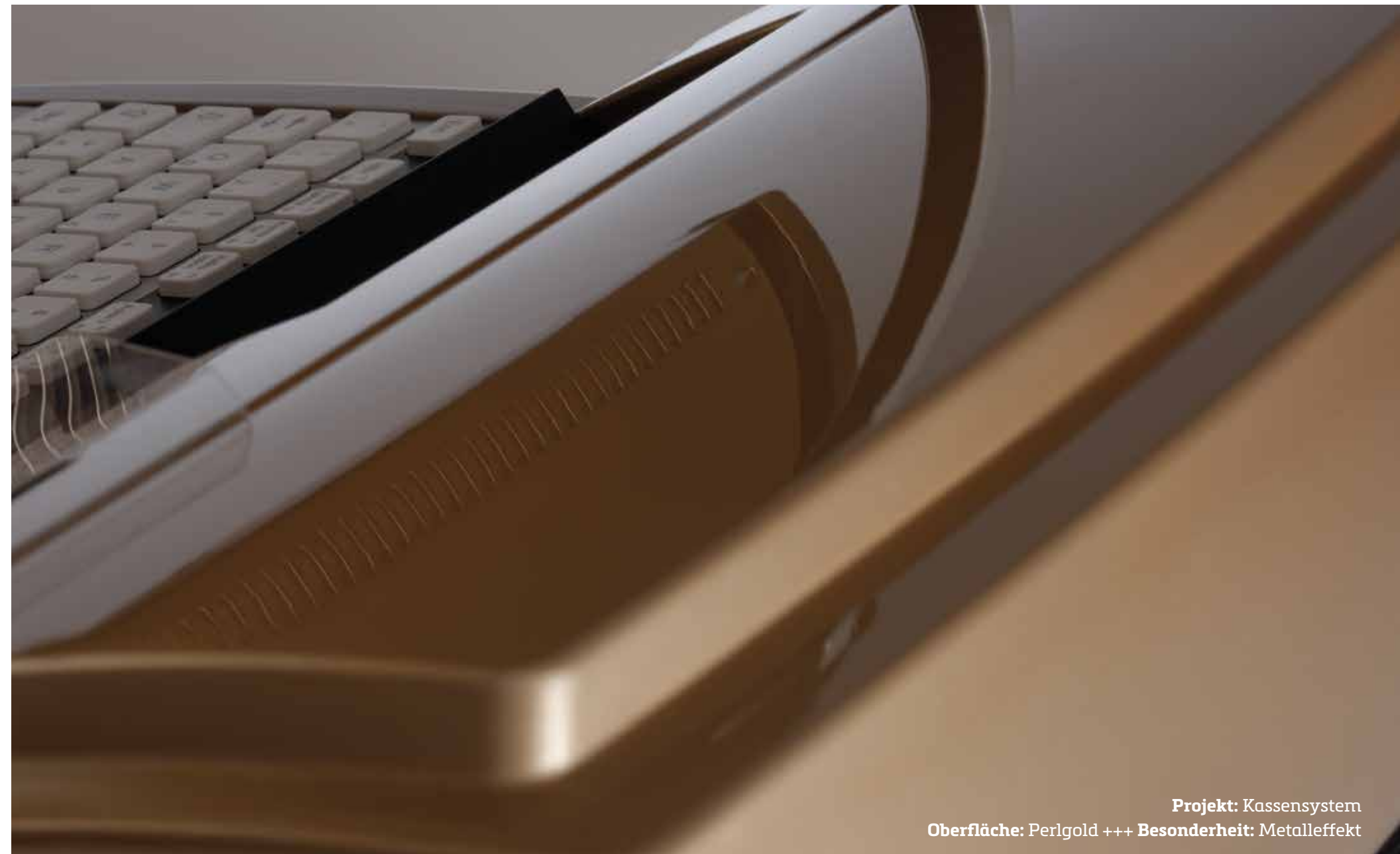
Projekt: Kassensystem Oberfläche: Perlgold +++ Besonderheit: Metalleffekt

Design ist meist nur so gut wie seine Umsetzbarkeit. Wir haben die Grenzen für mögliche Oberflächen abgeschafft. Deshalb bekommen Interieur-Designer jedes Teil exakt mit der gewünschten Beschichtung, Individualisten ihr Lieblingsstück auch in Gold oder Unternehmen alles in der Farbe Ihres Corporate Designs – vom Möbelgriff bis zum -beschlag.